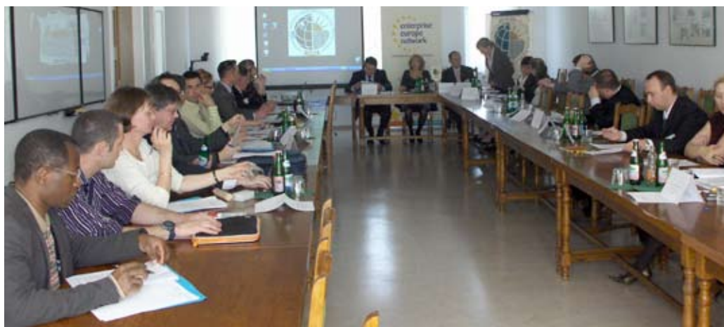
Kutatás-fejlesztési workshop a kamarában