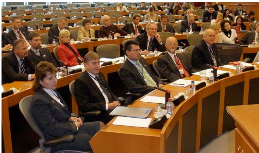
Már az egyik frakcióteremben is a vállalkozók tanácskoznak

– Valóban sokat várok a törvénytől, mely azt tűzte ki célul – ahogy Barroso elnök úr fogalmazott –, hogy az európai kis- és középvállalkozásoknak kevesebb adminisztrációval és több sikerrel kelljen számolniuk. A kis- és középvállalkozások érdekérvényesítő képessége mindenütt elmarad a nemzetközi nagyvállalatokétól – az előbbieket teremtik a leg-