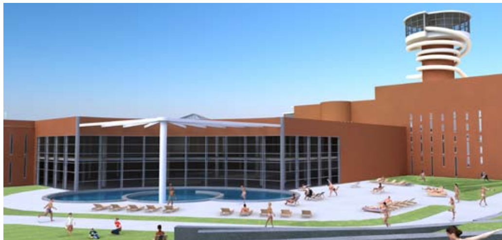
Az újszegedi Napfény fürdő látványterve

A komplex programmal rendelkező leghátrányosabb helyzetű kistérségek – a Turisztikai célú