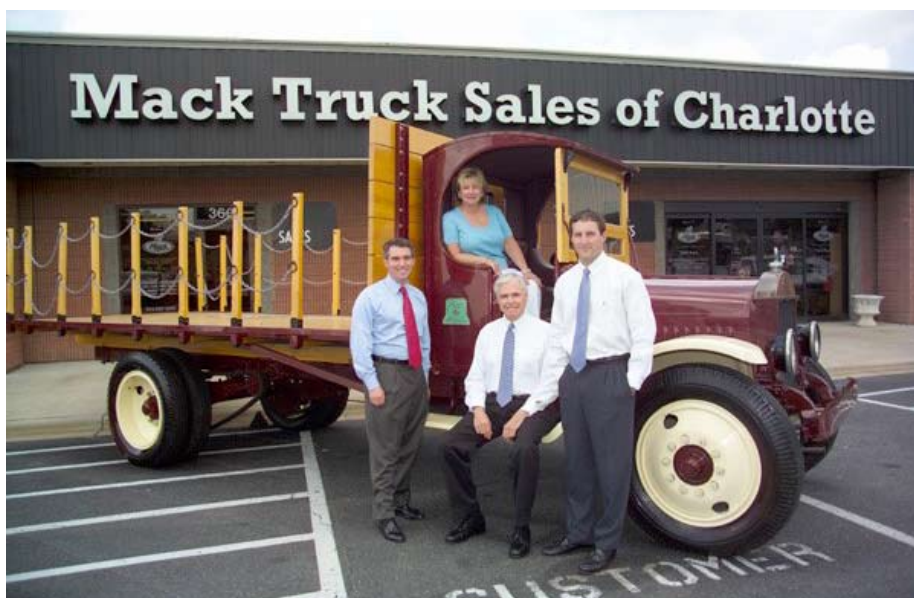
Az amerikai McMahon Truck groupot a Mack Truck familia 3. generációja vezeti

A kérdés nem csak nálunk kérdés, az Európai Unió hivatalaiban is komoly fejtörést okoz,