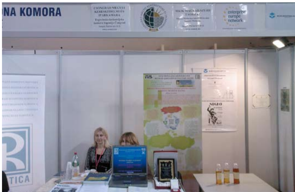
Információs stand a szabadkai vásáron

A vásárhoz kapcsolódva a CSMKIK gesztorságával működő magyar–szerb tagozat, az Enterprise Europe Network, a DARFÜ, valamint a Szabadkai Vállalkozók Egyesülete