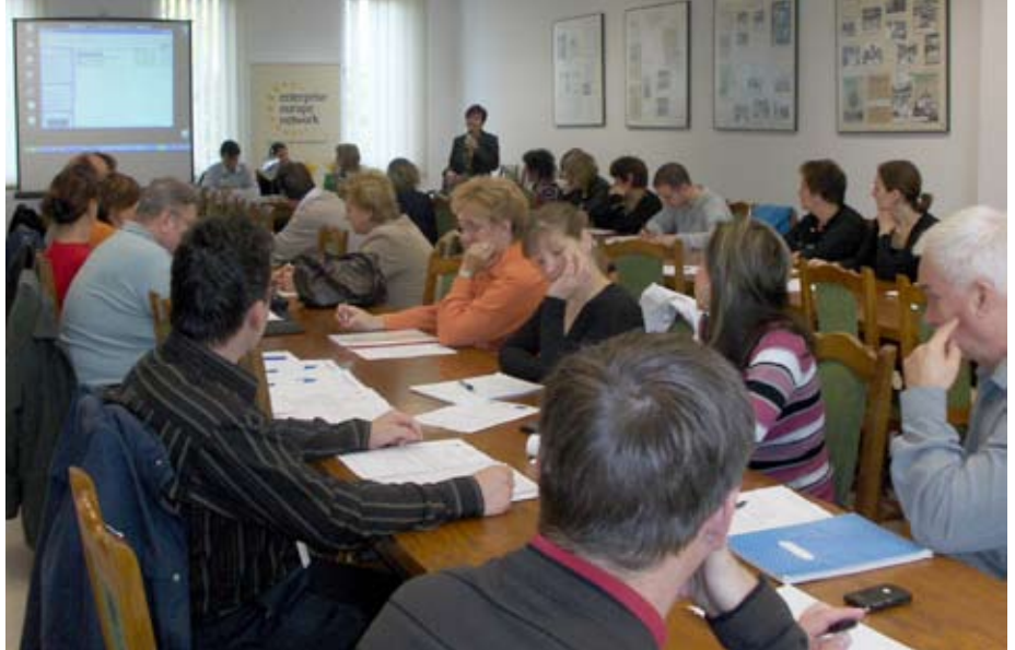
Tájékoztató a Kamarában. A REACH-rendelet hozta össze az érdekelteket

Kamaránk a téma fontosságára és az előregisztrációs határidő közelségére tekintettel 2008. október 29-én újabb tájékoztató rendezvényt szervezett Szegeden, az Országos Kémiai Biztonsági Intézet munkatársainak közreműködésével. Az alábbi tájékoztató anyag – mely a legfontosabb tudnivalókat tartalmazza – az OKBI szakmai segítségével készült.