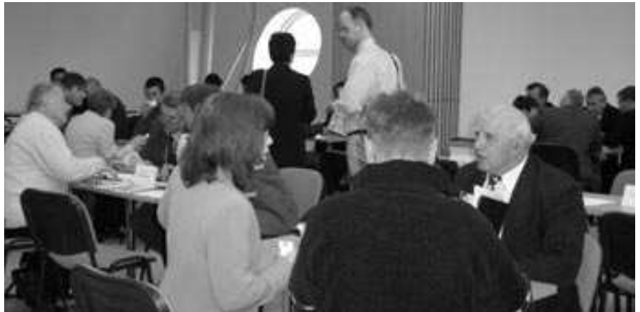
Az üzletek nem az égben köttetnek

Bosznia-Hercegovina a közelmúltban ugyan tragikus, pusztító háborún esett át, de tudni kell, hogy azt megelőzően iparilag fejlett köztársasága volt Jugoszláviának. A hightech iparágak közül a szarajevói magyar nagykövet külön is kiemelte a repülőgép-, illetve helikopter-összeszerelést. Olyan ipari és munkakultúra található Bosznia-Hercegovinában, amire bátran lehet építeni egy hosszabb távú gazdasági együttműködést. Ráadásul a magas munkanélküliség miatt, szabadon áll rendelkezésre magasan képzett, de olcsó munkaerő.