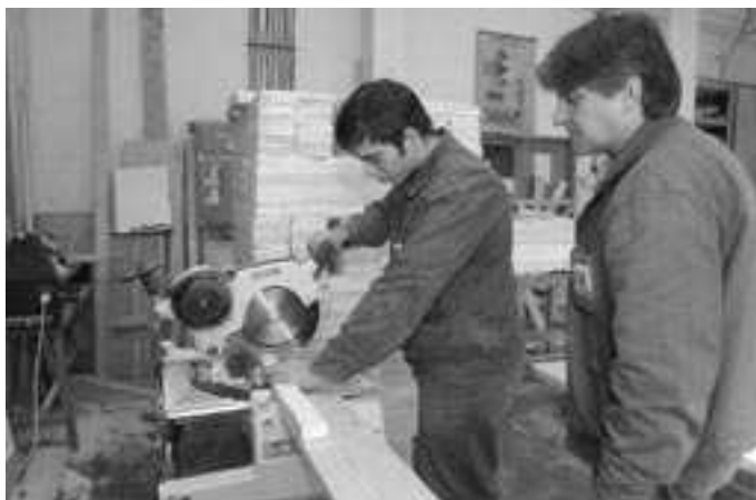
A Kalmár Zsigmond szakiskolában jó színvonalon oktatják a tanulókat

A CSMKIK Hódmezővásárhelyi Városi Szervezete, megalakulása óta szoros kapcsolatot épített ki a városban működő szakképzési intézményekkel és az önkormányzat oktatási kabinetjével. Fórumokon, találkozókra próbáltuk megértetni és elfogadtatni, hogy a szakképzés és a gazdaság fejlődése, sőt még a már elért szint megtartása szempontjából is kiemelt fontosságú ügy. Ha képes a gazdaság szükségleteinek kielégítésére,