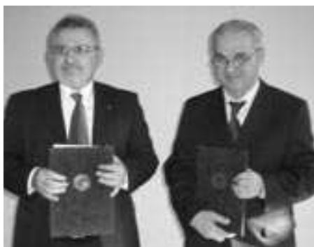
Szeri István és Nikola Tolimir aláírták a két kamara közötti együttműködési megállapodást

Szarajevói nagykövetségünk bemutatja azt a gazdasági környezetet, amelyet a bosznia-hercegovinai piacokra lépő, ott tartós berendezésre készülő vállalkozásoknak jó ismerni. Számos gazdasági megállapodást sikerült már megkötönni a két ország között, ilyenek a közúti személyszállítási, áru fuvarozási megállapodás; a beruházásvédelmi egyezmény; a pénzügyi együttműködési szerződés, vagy a szociális biztonságról szóló megállapodás. 2006-ban gazdasági együttműködési megállapodás született a két ország között. Tavaly több mint másfél tucat korábbi, megújított magyar-jugoszláv egyezményt emeltek át a magyar-boszniai kétoldalú kapcsolatokba. Várhatóan még az idén elkezdődik a kettős adóztatás elkerüléséről szóló – a korábbi jugoszláv egyezménynél korszerűbb – megállapodás kidolgozása.