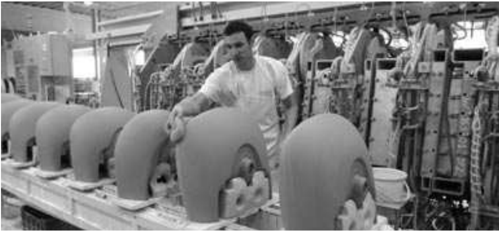
A Villeroy biztos munkaadónak számít Vásárhelyen

➤ az adott területen beiskolázni, majd kibocsátani. Itt a továbbiakban említett, hatásosan, következetesen megvalósított pályaaorientációtól és az átképzések szorgalmazásától várható eredmény.