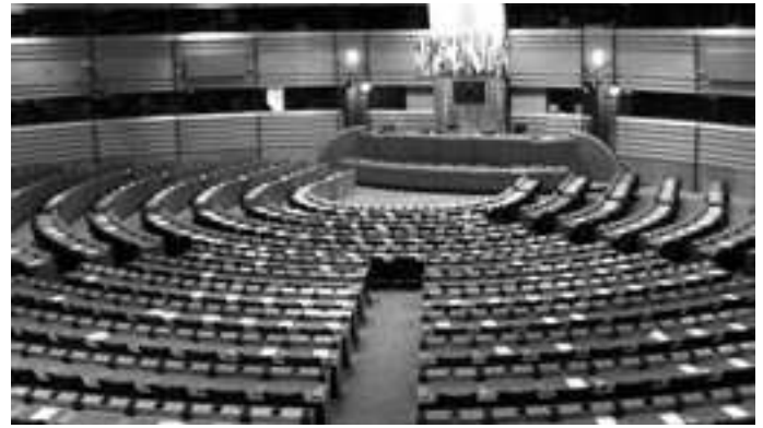
Az Európai Parlament plenáris ülésterme

A parlamenti bizottságok jelentései ezután a plenáris ülésekre kerülnek, ahol megvitatják és szavazásra bocsátják őket. Az Európai Bizottság általában elfogadja a módosító javaslatokat. Míg a parlament megvitát egy kérdést,