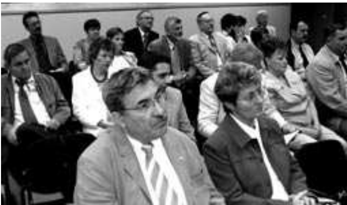
Csongrád megyei vállalkozók az Európai Parlamentben – figyelnek

Az európai uniós jogszabályok általában a következőképpen jönnek létre: a jogalkotásban, rendeletek és irányelvek esetében, a kezdeményezési jog az Európai Bizottságnál van, amely javaslatokat nyújt be a parlamenthez és a miniszterek tanácsához. Ezután a parlament 20 bizottságának egyike kidolgoz egy jelentést, amit benyújt a parlamentnek megvitatásra. A bizottságok minden olyan területet lefednek, ahol az Európai Uniónak jogalkotási jogköre van a mezőgazdaságtól kezdve, a halászaton keresztül, az ipar, a közlekedés, a környezetvédelem, a szabadságjogok, a fogyasztóvédelem kérdéseit és egyéb területeket.